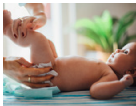
WICKELN Dreckige Windel runter, neue drauf. Fertig. So besser nicht. Denn Knuddeln und Quatschen beim Wickeln gefällt Mutter und Kind.