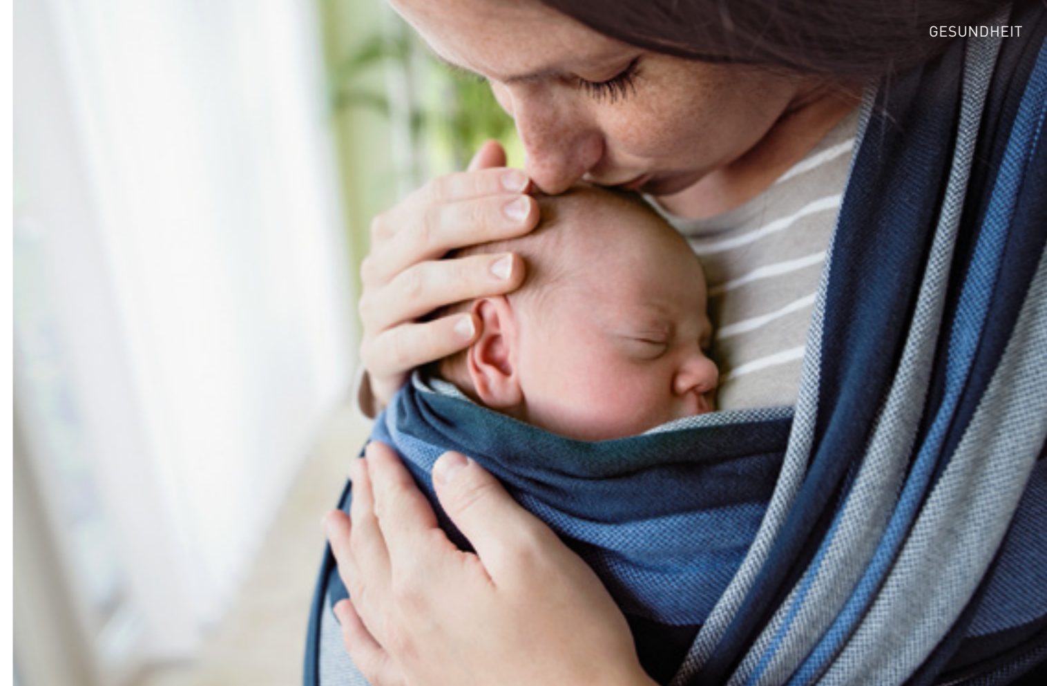
Eine sanfte Umarmung, ein hingehauchter Kuss – viel Liebe lässt beim Baby viel Urvertrauen wachsen.