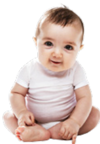
Rat und Tat von anderen hilft, den manchmal anstrengenden Alltag mit dem Wonneproppen zu meistern.

3 Probieren Sie eine Tragehilfe aus. Babys brauchen viel Körperkontakt. Den Säugling in einem Tragetuch oder einer Tragehilfe bei sich zu haben, ist eine gute Möglichkeit, dieses Bedürfnis zu stillen. Babys spüren den Herzschlag der Mutter und fühlen sich geborgen. Und Mutter oder Vater können nebenbei sogar den Haushalt erledigen.