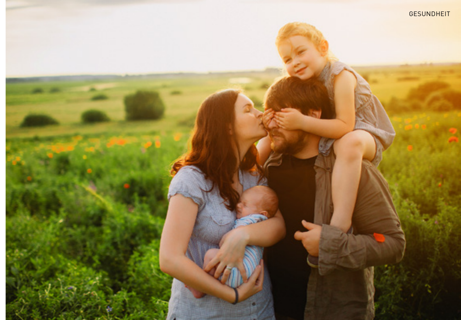
Schutz und liebevolle Zuwendung brauchen Kinder vom ersten Lebenstag an.

4. Unsicher desorganisiert gebunden: Das Kind verhält sich bizarr. Es erstarrt, schaukelt oder dreht sich im Kreis. Dieser Bindungsstil tritt oft auf, wenn die Bezugsperson unter einem unverarbeiteten Trauma leidet und/oder wenn sie das Kind misshandelt.